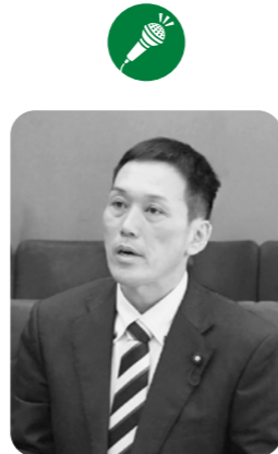
伊藤 貴之 議員

答 この事業は高齢者が冬期間は閉じこもりがちになるので、そのための事業である。その他の期間はヤクルトを配達しながら、安全確認をしてもらう見守りサポート支援事業も行っている。