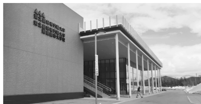
東北農林専門職大学

つなげることを期待するところである。 村の農業振興の大きな課題の一つである、新規就業者対策、農業後継者対策において東北農林専門職大学には大きな期待を寄せている。卒業生から就業先として大蔵村の農業を選択していただくためには、村の農業が魅力的でなくてはならない。大学との連携の推進と合わせて、農業振興についても注力していく。