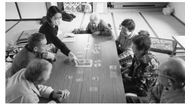
お試しサロンの様子

答 男性の参加については押し付けにならないよう配慮しながら取り組み、PRの強化を進めていきたい。サロン活動については「お試しサロン」として職員が地区に出向き説明するなど、活動の広がりを図っている。