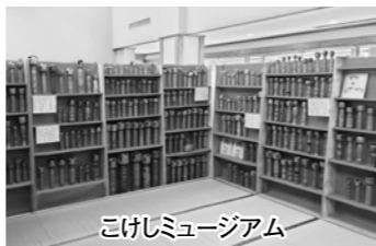
こけしミュージアム

一方で、施設の老朽化や設備不具合、食堂売上の減少、職員体制縮小による業務負担の増加などの課題も確認されました。委員会では、関係者と情報共有を図りながら、持続可能な施設運営のあり方について引き続き検討していきます。