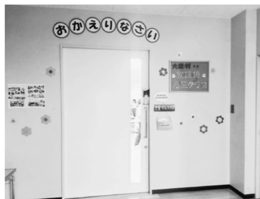
放課後児童クラブ

答 子育て支援住宅の建設、医療費や保育料の無償化など実施をしている。学童保育は平成21年から開始し、令和2年度からは「放課後児童クラブ」に名称を変え、利用対象児童を4年生から