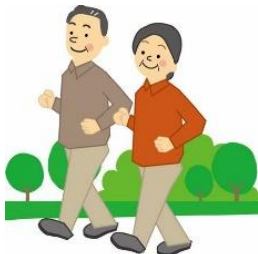
ウォーキング (速歩)