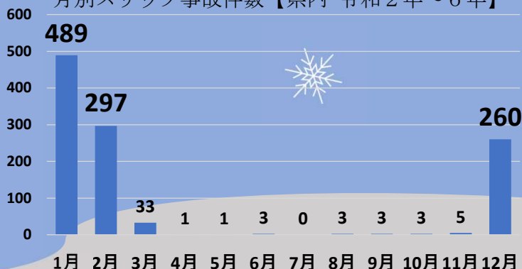
月別スリップ事故件数【県内 令和2年～6年】

橋の上、交差点、カーブ、日影は凍結注意！ 濡れた路面に見える 「ブラックアイスバーン」に注意！