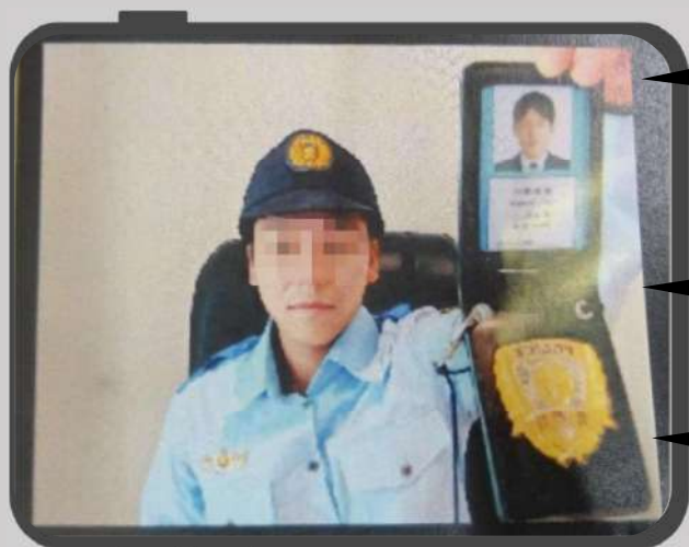
【ニセの警察官と警察手帳】