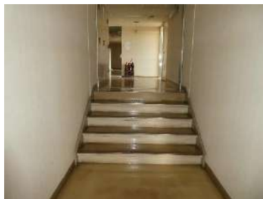
東庁舎と西庁舎との段差（3 階）

そのため、身体の不自由な方の移動が困難な状況で、安全性や利便性への配慮が不十分な状態となっています。