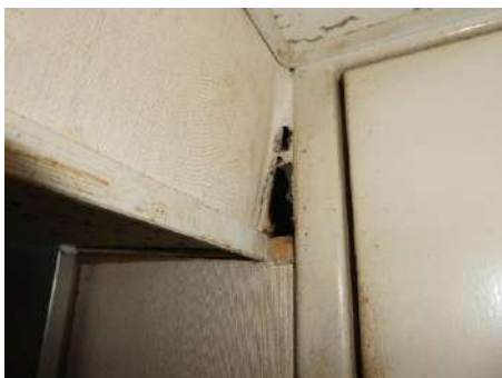
東庁舎と西庁舎との 接続部分のズレ

役場庁舎は、災害発生時の防災拠点としての機能を担う重要な施設であり、災害発生後も行政機能を維持できることが求められています。しかしながら、現在の庁舎では、防災拠点的功能に大きな不安を抱えています。