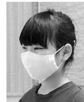
↑水色の布製マスク

感染症予防対策用の物品購入が大変困難な状況にあったため、4月20日(月)より2歳児から中学3年生までと妊婦の方を対象に布製マスクを2枚ずつ、高校生と65歳以上を対象に紙製マスクを2枚ずつ配布しました。