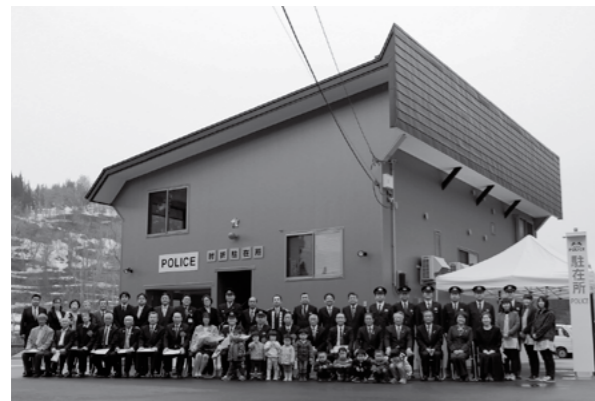
▲ 完成した肘折駐在所

4月18日(水)、舩玉砂防堰堤で水力発電所建設工事の安全祈願祭が行われました。この水力発電所は、村と工営エナジー、もがみ自然エネルギーの3者が官民共同で進めている事業です。安全祈願祭には関係者など約60名が出席し、工事の安全と無事完成を祈願しました。大蔵村の豊富な水を生かしたクリーンなエネルギー創出のため、平成32年稼働を目指し工事が始まります。砂防堰堤を活用した水力発電は全国的にも珍しく、モデル事業としても注目されています。