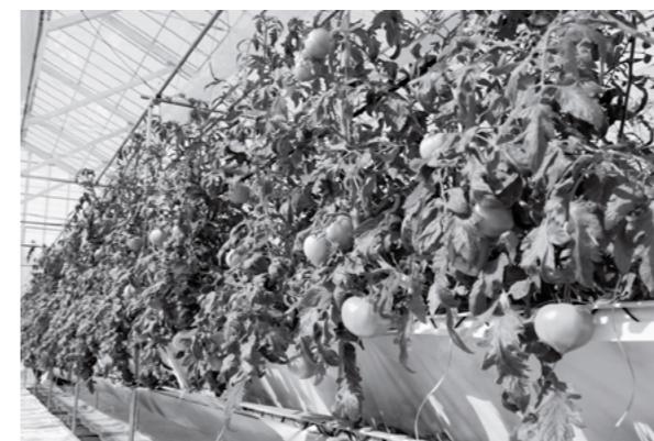
▲ 次世代型ハウスで実ったトマト

4月16日(月)、村内火災予防運動パレードの出発式が役場で行われました。最上広域消防南支署・大蔵村消防団第2分団消防積載車2台・清水駐在所パトカーと隊列を組んで村内各地を巡回し、火災予防を呼びかけました。春は空気が乾燥するとともに、風が強くなり火災が発生しやすい季節です。火の取り扱いには十分注意し、火災予防に努めましょう。また、住宅用火災予報器は必ず設置し、設置後10年以上となる予報器についても電池切れがないかなどの点検を行いましょう。