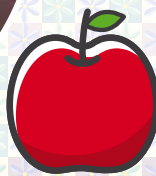
★すきなもの キュアエールとりんご