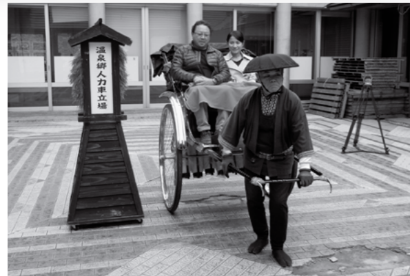
▲ 観光客を乗せ肘折いでゆ館を出発する人力車