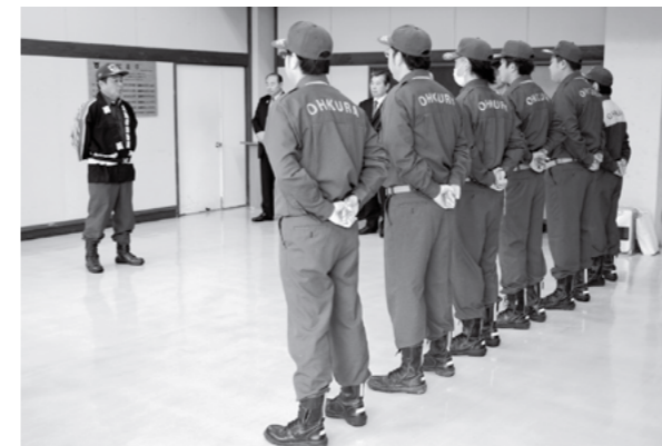
▲ 火災予防運動パレード出発式

4月10日(火)、役場で東北電力株式会社との「災害時の協力に関する協定書」の締結式が行われました。地震や台風等の災害に伴い、大規模な停電等が発生した場合に、東北電力と村が緊密な連携を保つことで、電力の迅速かつ円滑な復旧を図ることを目的に協定を締結しました。村が災害対策本部を設置した場合、必要に応じて社員を派遣し、災害情報の収集・伝達等に関する調整を図ることについても記載されています。