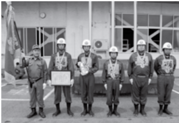
▲3位入賞を果たした清水チームの皆さん。おめでとうございます。

7月26日(日)、最上広域消防本部において山形県消防操法最上支部大会が開催され、村の代表として出場した清水チームが、見事3位入賞を果しました。連日に亘る過酷な練習の成果を十分に発揮し、個人の速さ・正確性はもちろんのこと、村の大会以上の見事な連携で操法を展開されました。要員の皆さんをはじめ、団員・関係者の皆さん、長期間、大変お疲れ様でした。