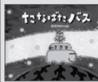
※中央公民館で借りられます。読み聞かせ時間「3分」。

うでをぐるぐる回してふきとばそうとしますが、はれそうにありません。はたして、ねずみくんたちはどうやって雨ぐもをふきとばすのでしょうか? こどもたちが出発のカウントをしたり、うでをぐるぐる回して参加できるたのしい七夕の絵本です。