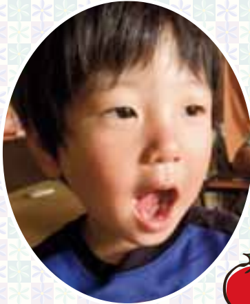
★すきなもの トマトが大好き