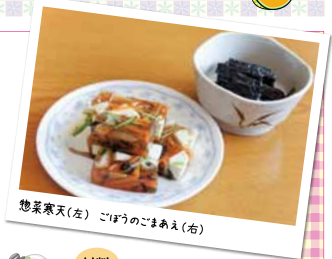
惣菜寒天(左) ごぼうのごまあえ(右)

このコーナーでは、地元の素材を使った おいしい一品をレシピとともに紹介します。 ぜひお試しください♪