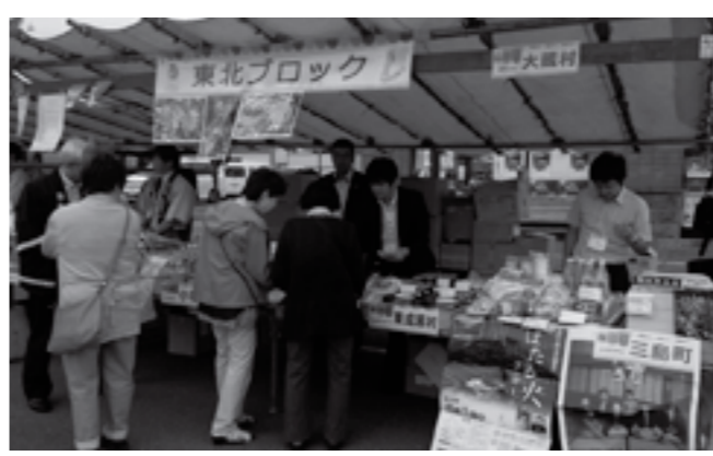
▲大蔵特産品の物販・PRも好評でした