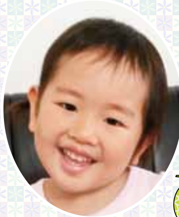
★すきなもの アイスとメロン