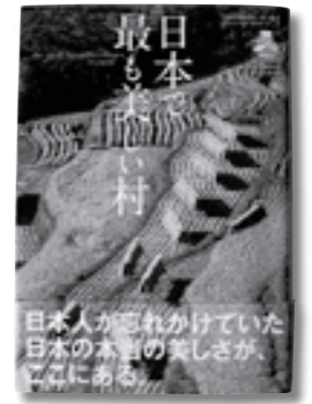
▲第1弾ガイドブックも大好評!

大蔵村が加盟しているNPO法人「日本で最も美しい村」連合のオフィシャルガイドブック第2弾「日本で最も美しい村2」が、今年10月、ハースト婦人画報から出版されることになりました。