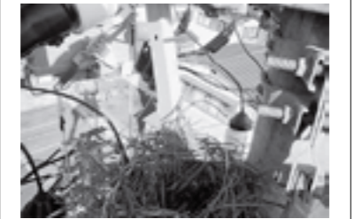
東北電力新庄営業所配電課

カラスの営巣が原因で、停電になることがあります。見つけたら、付近の目標や電柱名、電柱番号などをご連絡ください。ご協力をお願いします。 コールセンター