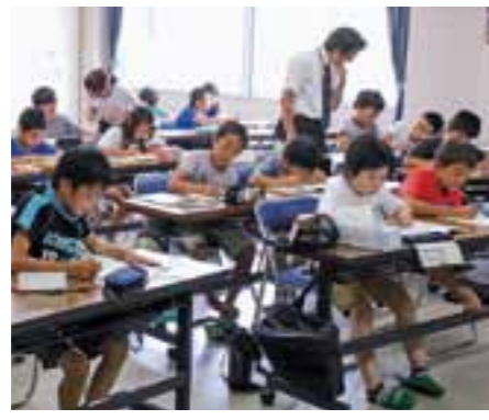
▲対象者を中学生に加え小学5・6年生に拡大した村営学習塾「未来塾」

私は、住みよい村づくりは人づくりからと考えており、将来を担う若者には、広い視野と識見を身につけさせるためにも、学習意欲の向上を目指した学校教育の推進など、誰でも・どこでも・手軽に取り組むことができる人づくり教育の充実を図るとともに、地域と一体となって子供たちの愛郷心の醸成を図ってまいります。