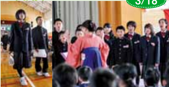
大蔵中学校卒業式 (卒業生24名)