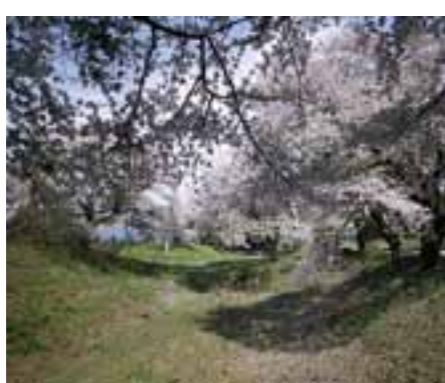
▲本丸、二の丸全域を含み県指定史跡に指定された清水城跡

支援や財政支援、情報支援など多様な支援を惜しみなく行うとした、地域活性化に関する政府方針を打ち出しました。村でも緊急的取り組みとして「まち・ひと・しごと創生総合戦略」に示された、地域消費喚起・生活支援型事業を積極的に取り組んでまいります。さらに、地域自立応援施策として制度化された、「地域おこし企業人交流プログラム」や「地域おこし協力隊」事業にも積極的に取り組むとともに、定住自立圏構想などを通じて、最上地域8市町村が協力して地域の活性化に繋がってまいります。