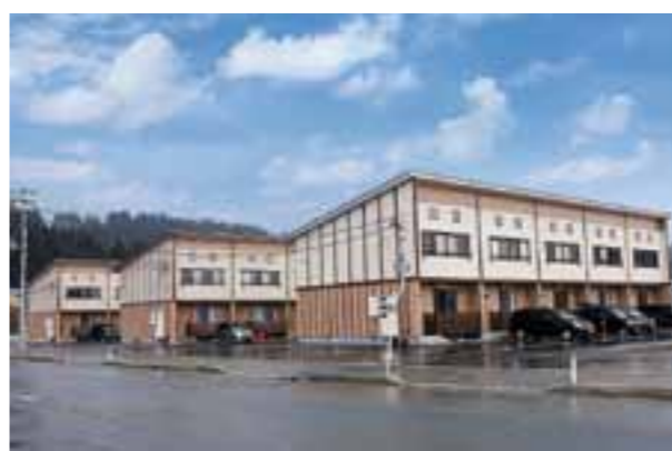
▲1棟増棟し、15組の子育て世帯の入居が可能な子育て支援住宅

私は、村の元気を創出するためには、ある程度の人口を確保し続ける必要があると考えます。こうしたことから、少子化対策