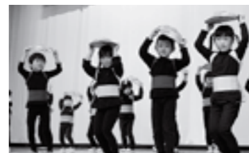
▲保育所の子供たちもかわいい踊りで会場を盛り上げてくれました

3月1日(日)、健康のつどいが中央公民館で開催されました。今年も、「減塩で みんな生きいき 元気な大蔵村」をスローガンに掲げ、減塩をきっかけに生活習慣を見直し、みんなが病気にかかることのない健康な生活を築き、生きいきとした村の実現を目指していこうと、表彰式や健康づくり推進協議会委員による寸劇、講師を招いての講演会など様々な催しが行われました。 当日は、約450人もみなさんが集い、寸劇での診療所の先生方の名演技、そして、講師による幼少期に過ごした祖母の何事も前向きにとらえる姿や苦勞を苦勞と思わず笑いに変える姿の話があり、会場は常に笑いがある楽しい雰囲気に包まれていました。また、歳を重ねても家族での役割や生きがいを持ち続けることが認知症の予防にも繋がるなど、長く豊かな人生を送る秘訣について再確認していました。