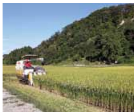
▲基盤整備を行い作業効率が上がった赤松袋地区の水田

私は、常に基幹産業である農業の活性化なくして村の発展はないと申し上げております。昨年の米価下落は、農村集落の存