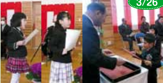
大蔵村保育所卒園式 (卒園児童17名)