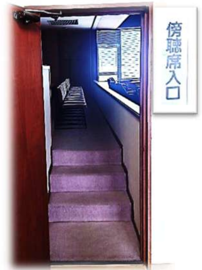
(正面玄関から入り、2階議場へ)