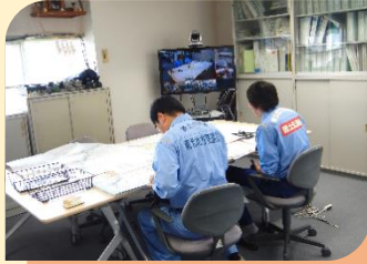
出張所でのTV会議を利用した情報共有訓練の様子

訓練では、地震発生時における被災状況の迅速かつ的確な伝達及び情報共有などの災害対応を実施しました。