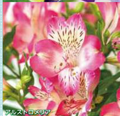
アルストロメリア