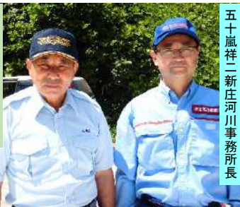
五十嵐祥二新庄河川事務所長