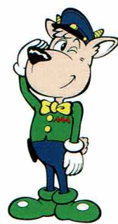
山形県警察 マスコットキャラクター カモンくん