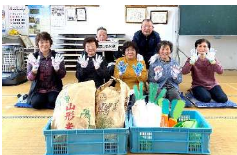
▲「ピ」の軍手をつけて集合写真（豊牧）

「おおくら———」とどのぐらい長く伸ばせるかを競います。喉の筋力や肺機能を鍛えることができます。