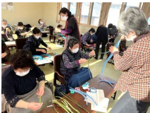
▲愛 kai (合海) でのかご編み

地区のサロンに参加したい方、地区で新しく立ち上げたい方は地域包括支援センターまでご連絡ください。