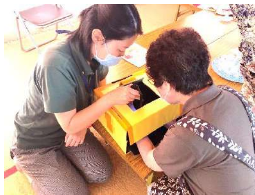
▲通り親睦会での保健師による手洗い講座