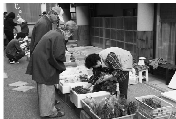
▲ 山菜の美味しい調理方法なども教えてもらうことができます。元気な朝市のお母さんたちにぜひ会いに来てください。

4月20日(月)から肘折温泉街で肘折朝市が始まりました。初日となるこの日は、心待ちにしていた多くの観光客が足を運び、大変賑わっていました。店先にはコゴミやアイコなどの山菜のほか、手作りの総菜、漬物など数多くの品物が並んでいました。朝市のお母さんたちと「久しぶり～」など言葉を交わす観光客もあり、毎年楽しみに訪れている方が多い様子も伺えました。5月は山ウドやコシアブラなど、更に多くの山菜が並ぶ予定です。村内外からのお越しをお待ちしております。