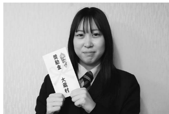
▲ 昨年に引き続き全国大会への出場おめでとうございます。今後の活躍も期待しております。

4月9日(木)、新庄信用金庫様より大蔵小学校の児童全員に「新庄まつり」の絵本が寄贈されました。この絵本は、270年の歴史を持つ新庄まつりの起源がわかりやすく書かれています。子どもたちに読んでもらうことで、昔の人のたちの想いを忘れず、新庄まつりを通じて郷土愛の醸成につながってほしいという願いから寄贈していただいたものです。ありがとうございました。