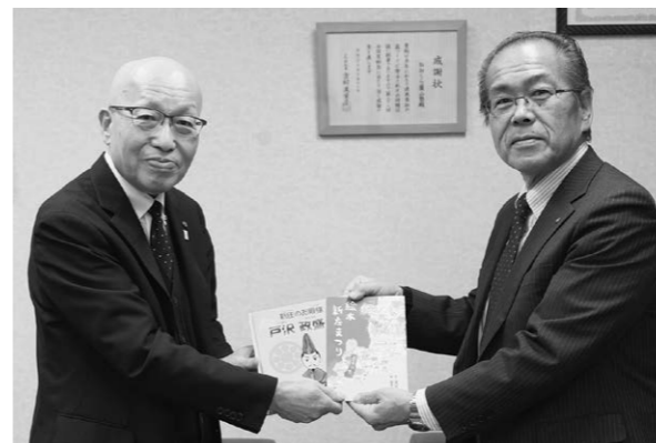
▲ 寄贈していただき、ありがとうございました。郷土愛の育成に活用させていただきます。