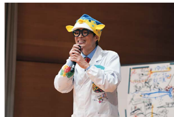
▲素敵なイラストは表紙にも!子どもたちやさかなクンの笑顔をぜひご覧ください!

この種目の効果 猫背予防とつますきにくく転びにくい体に。握力が鍛えられるので、ペットボトルが開けやすくなります。