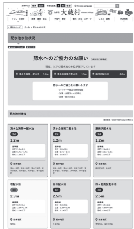
▲ページの表示予定図