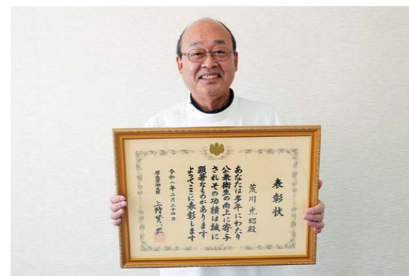
▲村の健康を支えてくださった功績に深く感謝いたします!

1/29(木)、国立大学法人東京海洋大学客員教授・名誉博士であるさかなクンを講師に迎え、大蔵村教育講演会を開催しました。海の中の環境についてやそれに合わせて進化した魚の生態について小・中学生でもわかりやすい言葉で解説しました。また、リクエストした魚について55秒で解説しながら描くパフォーマンスも行い、イラストはリクエストした本人へプレゼントされました。