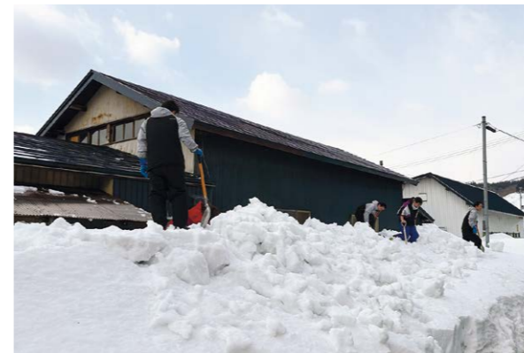
▲県内でも除雪の事故が頻発。安全第一でボランティア作業に取り組んでいただきました。

除雪ボランティアは、訪問し顔を合わせ話をすることで、高齢者の閉じこもり予防にもつながっています。