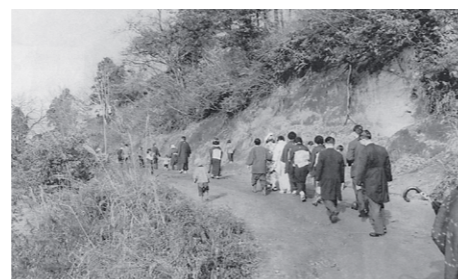
▲結婚式(むがさり)行列