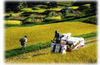
ふるさと産業の振興