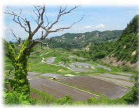
環境や景観の保全