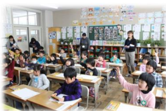
明日を担う子供たちの教育