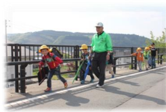
安全安心な村づくり